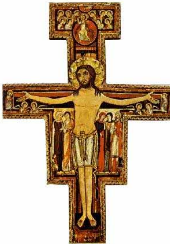
Kruis van San Damiano dat tot Franciscus zei: 'Ga, Franciscus, repareer mijn huis, want je ziet dat het op instorten staat' .