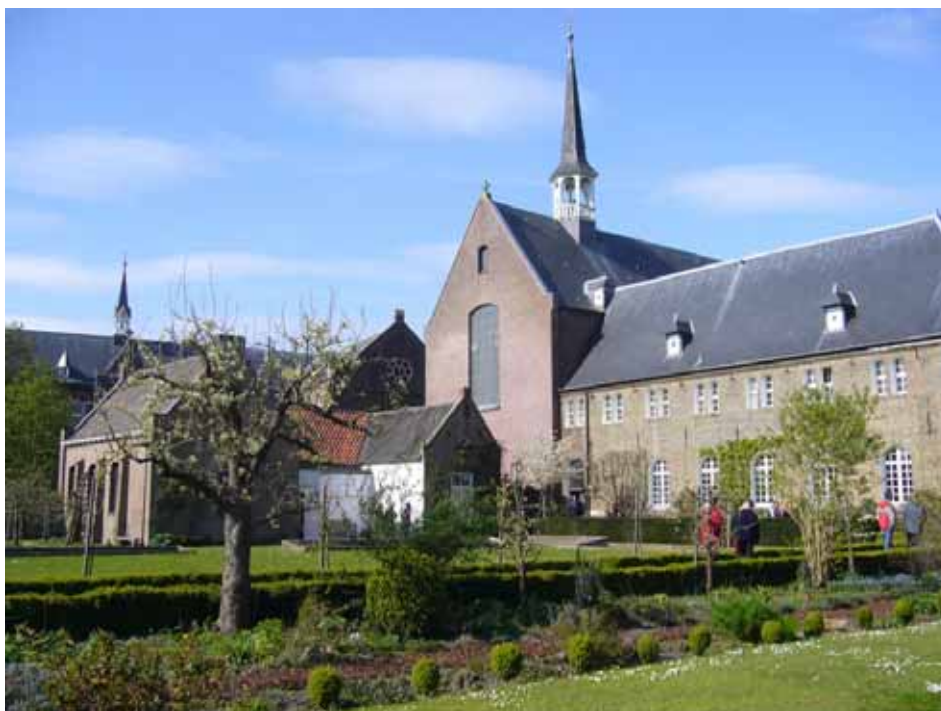
Franciscaans klooster in Megen