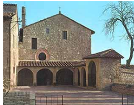
Kerk van San Damiano