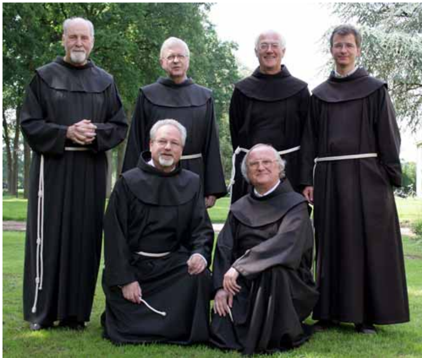
Franciscaanse broeders gekleed in habijt.