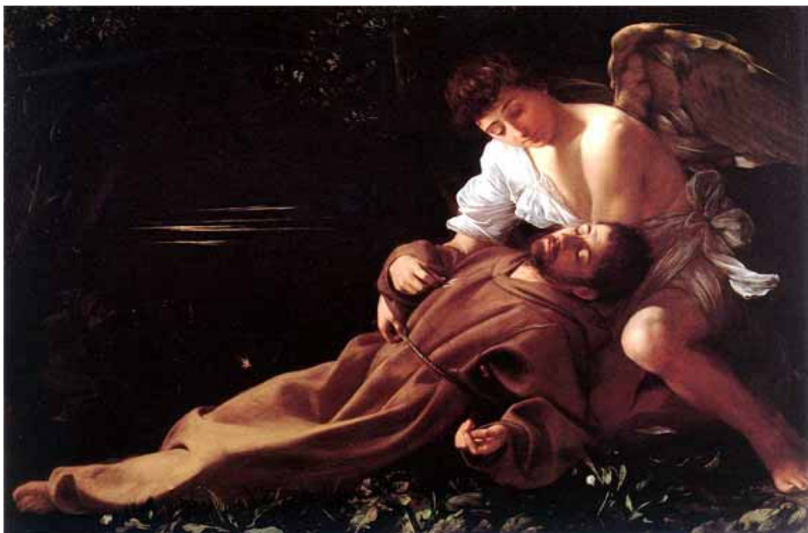
'Sint Franciscus in extase', Caravaggio, 1596

Kortom, Franciscus' boodschap sprak mensen aan, het viel in vruchtbare aarde maar de presentatie van zijn ideaal, zijn vertoning was uniek. Mensen kregen een voorbeeld aangeboden, een rolmodel om na te volgen, geen grote heilige held op grote afstand. Dat doet Franciscus zelf ook al in zijn testament: zich voorstellen als een zondaar die zich bekeert. Daar konden mensen zich in herkennen. Dat blijkt uit het aantal volgelingen dat bleef stijgen na ieder charismatisch optreden waarin hij zijn boodschap verkondigde.